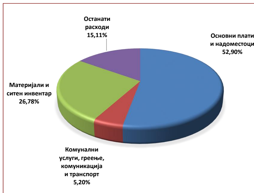
Графички приказ на структурата на реализирани расходи на ЈЗУ во период 01.01-30.11.2019 година